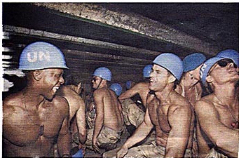
'Blauwhelmen' tijdens de Gay Parade.