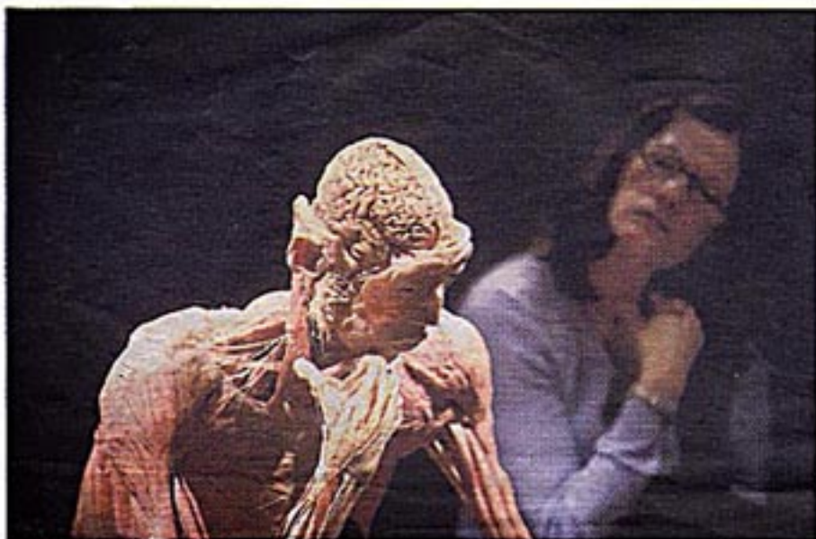
Bodies-expositie in de Beurs van Berlage.