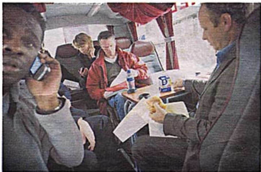
Wouter Bos (PvdA) op campagne.